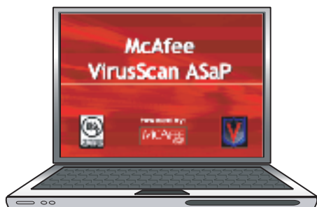
従来のワクチンソフトとの比較

その他のワクチンソフトの場合、自動アップデートと言っても結局は「アップデートボタン」を押すという手作業が入りますが、McAfee VirusScan ASaPは最新のプログラムもエンジンもわざわざダウンロードする必要もなく、すべて全自動で更新します。